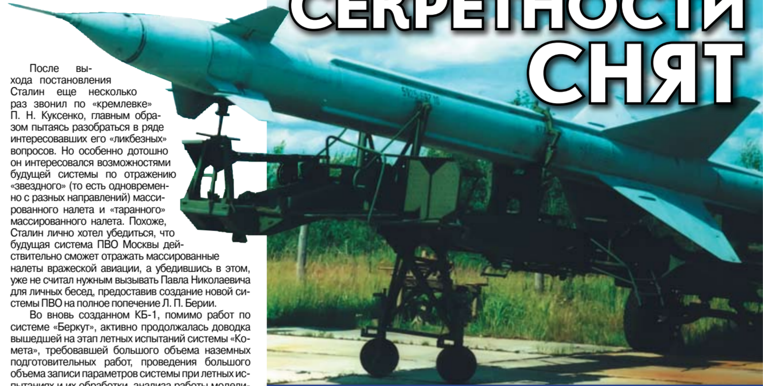
Окончание. Начало в № 9

В приказе от 12 августа о СБ-1 ничего не говорилось. Формально оно перестало существовать 28 августа, когда Устинов еще одним приказом № 469 переименовал СБ-1 в КБ-1: «Изменить наименование «Спецбюро № 1 МВ» (СБ-1) на «Конструкторское бюро № 1 (КБ-1)».