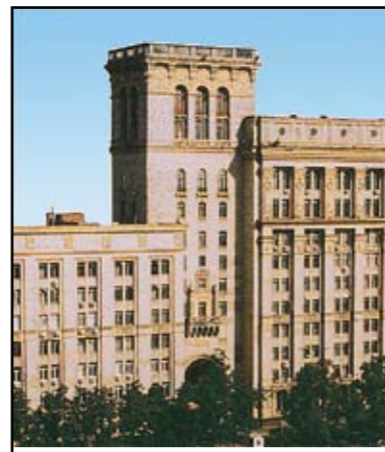
ОКТАБРЬ 2010 г. № 10 (93)

А от зимнего холода мы защищены? - У нас есть такие подразделения, как 10-й корпус, где ведется ремонт. Конечно, сложно проводить ремонт и одновременно обеспечивать оптимальные условия труда. Но мы все это отслеживаем. И если что-то выйдет за пределы нормы, первый звонок будет в отдел охраны труда. Это можно сделать через диспетчерскую «ВПК-Сооружение», которое нас обслуживает. Со своей стороны мы предпринимает шаги, чтобы они тоже за этим следили. Ведь иногда бывают довольно глупые по своей сути вещи: отключили что-то на момент сварки и не подключили заново, а люди страдают.